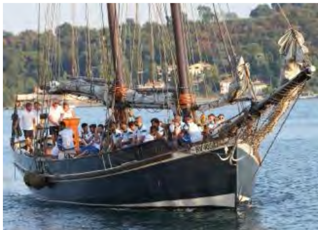
La Feralpi Salò è arrivata su un veliero alla presentazione di giovedì