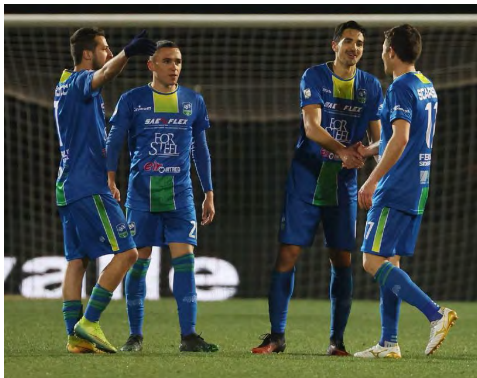
I giocatori della Feralpisalò festeggiano la vittoria contro la Virtus Verona