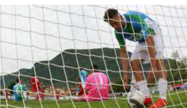
La delusione dei giocatori della Feralpi Salò dopo il gol subito

La Feralpi Salò non reagisce e prosegue sulla falsariga precedente: sconclusionata, molle, pigra. Le motivazioni contano molto e il fatto di essere già entrati nella griglia dei dieci induce a muoversi senza sprecare troppe energie. È un andamento lento, insomma. Poco importa che gli spettatori restino sconcertati e perplessi di fronte a si-