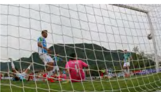
Cagliioni battuto: per la Feralpi Salò è sconfitta casalinga