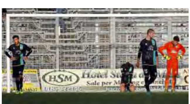
La disperazione dei giocatori della Feralpi Salò dopo il pareggio